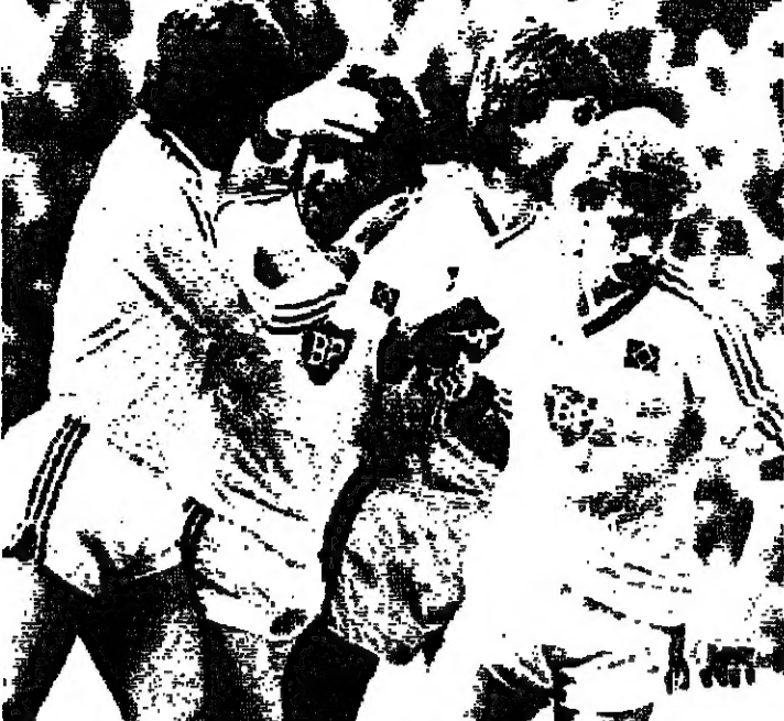
فيما يل الموقف في بطولات دوري كرة القدم في دول اوروبا.

انكزوا: اصيحت بطولة الدوري في متناول ايدي نادي ايفرتون، فبعد فوز ٢/٠ صفر على نادي سوك سيتي الذي يحل المركز الاخير تقدم نادي ايفرتون خطوة لاحراز لقب بطولة دوري انكلترا لكرة القدم ولا سيما بعد الهزيمة المفاجئة التي مني بها نادي توتنهام في واي هارت امام نادي ايسينستون ٢/٣ وهزيمة نادي مانشستر يونايتد ١/٢ في لوتون، اما افضل النتائج فقد حققها نادي ليفربول بفوزه ١/٢ في نيوكاسل ونادي توتنهام بفوزه ٢/٠ صفر على استون فيلا. اسكوتلندا: يتصدر نادي ايردين الدوري الاسكوتلندي لكرة القدم بفارق ست نقاط على النادي الذي يليه نادي سيلتيك غلاسغو، وبهذا يكون نادي ايردين قد ضمن الاحتفاظ بلقب. وتجدر الاشارة الى ان فوز نادي ايردين ٤/٠ صفر على نادي دومبارتون قد سمح له بالحفاظ على فارق النقاط بينه وبين نادي سيلتيك غلاسغو الذي فاز بدوره بسبولة على نادي سانت ميرين بثلاثة اهداف للثمة منهم هدفان من ضربتي جزاء، ولا يتوقع نادي ايردين سوى نقطتين لكي يتوج بطلا مرة اخرى. المانيا الغربية: كانت هزيمة نادي بايرن ميونخ ١/٢ في هامبورغ هي حديث الساعة في ألمانيا الغربية امس، ولم يتقدم نادي بايرن ميونخ على نادي بريوم بدوره على نادي بوخوم بهدف للثمة، اما نادي مونتسن غلاباخ فقد تعادل صفر/صفر في جوكينبرج مع نادي اوردينجن، اما نادي كولونيا وهامبورغ فيواصلان مشوارهما في بطولة كأس الاتحاد الاوروبي لكرة القدم.